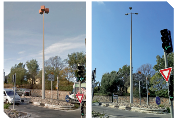
Travaux d'économies d'énergie Photos Avant / Après

En ce qui nous concerne, nous mettons en œuvre une action sur les réseaux d'éclairage public en proposant aux communes, de réduire les consommations de courant d'électricité, d'améliorer la qualité de l'éclairage et de diminuer les nuisances lumineuses. Le Syndicat procède au remplacement des luminaires en place par des luminaires à LED.