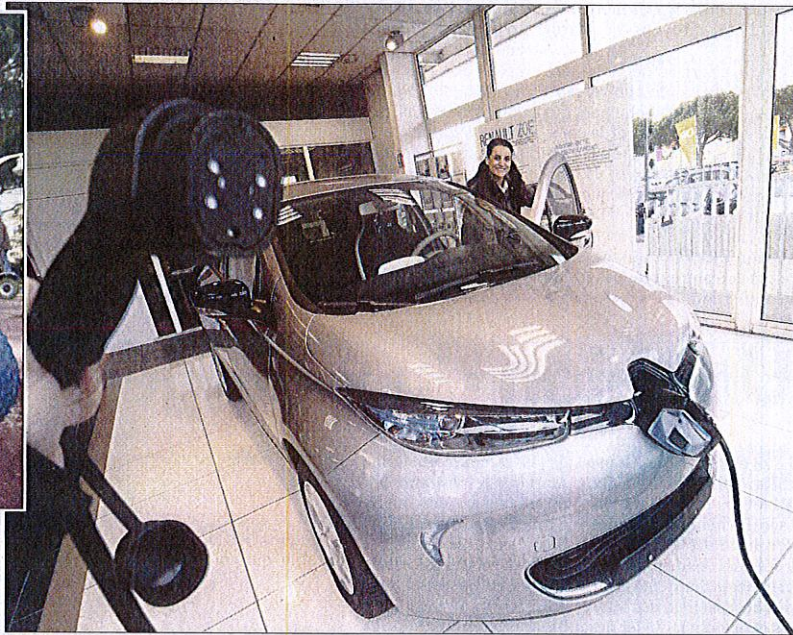
La part des voitures électriques dans le parc automobile ne cesse de grimper.

Dans le département, c'est en effet la première fois qu'un salon de ce genre est organisé. Volontiers en pointe dans le registre de l'innovation et du développement durable, la commune s'enorgueillit de brandir le label territoire à énergie positive pour la croissance verte.