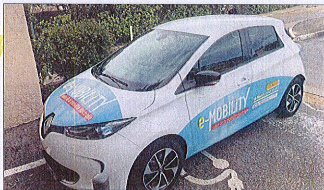
Une trentaine de véhicules électriques est attendue sur les routes du Var.